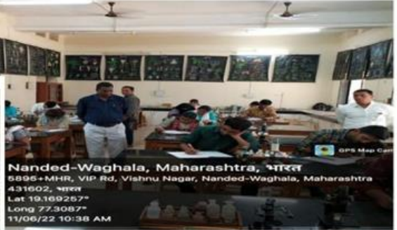
Nanded-Waghala, Maharashtra, भारत 5895+MHR, VIP Rd, Vishnu Nagar, Nanded-Waghala, Maharashtra 431602, भारत Lat 19.169257° Long 77.3087° 11/06/22 10:38 AM