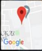
Nanded, Maharashtra, भारत 58C5+7H4, Yeshwant College Rd, Baba Nagar, Nanded, Maharashtra 431602, भारत Lat 19.170512° Long 77.308623° 09/05/22 01:43 PM